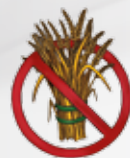
Bez dodatku zboża