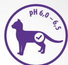
Ochrona dróg moczowych