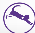
Serce + mięsień